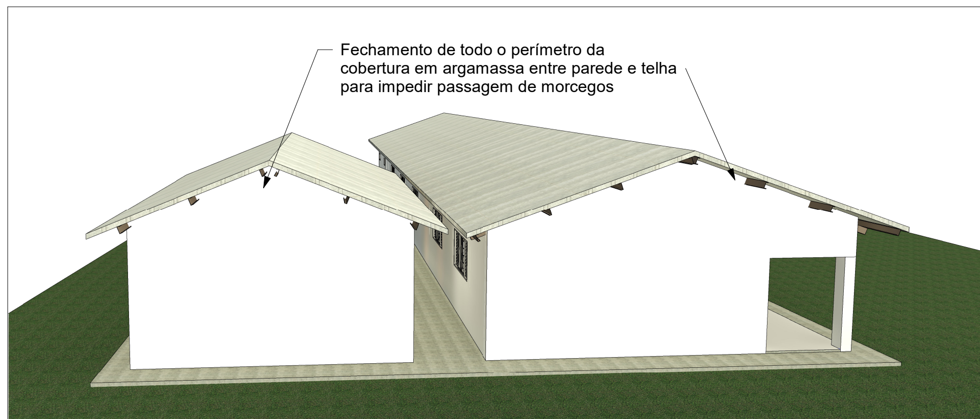
1 Perspectiva 01