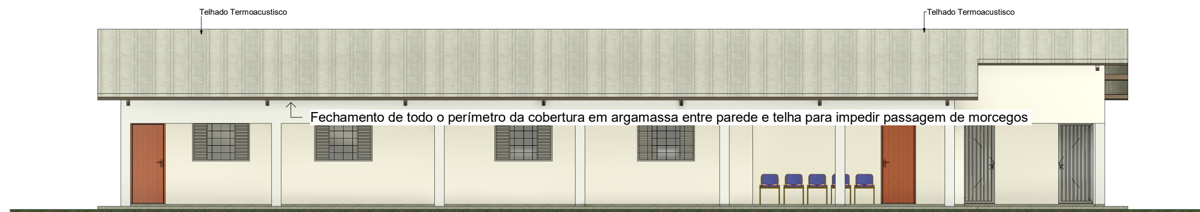
2 Elevação Frontal 1 : 100